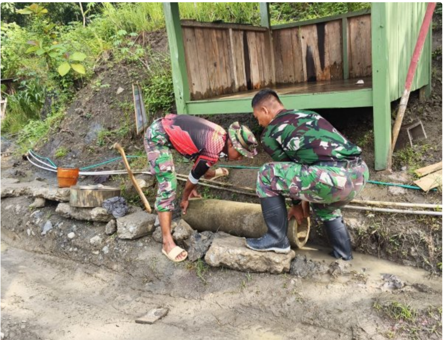
Foto: Personel TNI bersama warga melaksanakan pembangunan gorong-gorong di depan poskamling memastikan aliran air tetap lancar, bertempat Desa Somagede, Kecamatan Sempor, Kabupaten Kebumen, Jawa Tengah. Pada Jumat (20/2/2026).

KEBUMEN - Pembangunan infrastruktur dasar terus digenjut Satgas TMMD Reguler ke-127 Kodim 0709/Kebumen di Desa Somagede, Kecamatan Sempor,