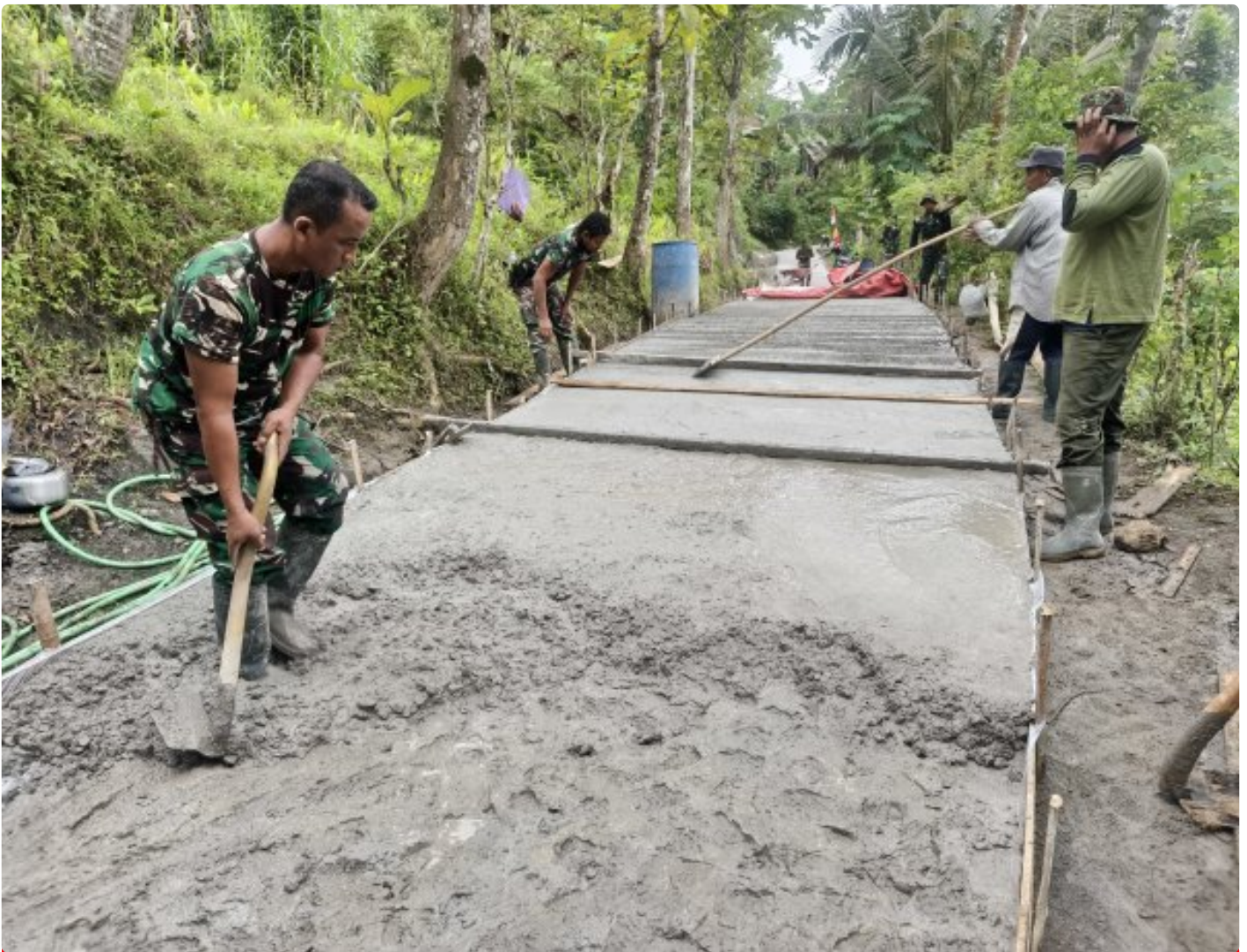
Foto: Pemandangan situasi lokasi meski langit Kebumen menitikkan rintik gerimis, semangat juang Satgas TNI Manunggal Membangun Desa (TMMD) Reguler ke-127 Kodim 0709/Kebumen dan warga Desa Somagede tak sedikit pun surut. Pada Kamis (19/2/2026).

KEBUMEN - Meski langit Kebumen menitikkan rintik gerimis, semangat juang Satgas TNI Manunggal Membangun Desa (TMMD) Reguler ke-127 Kodim 0709/Kebumen dan warga Desa Somagede tak sedikit pun surut. Pada Kamis (19/2/2026), mereka bahu-membahu melanjutkan pekerjaan vital: rabat beton