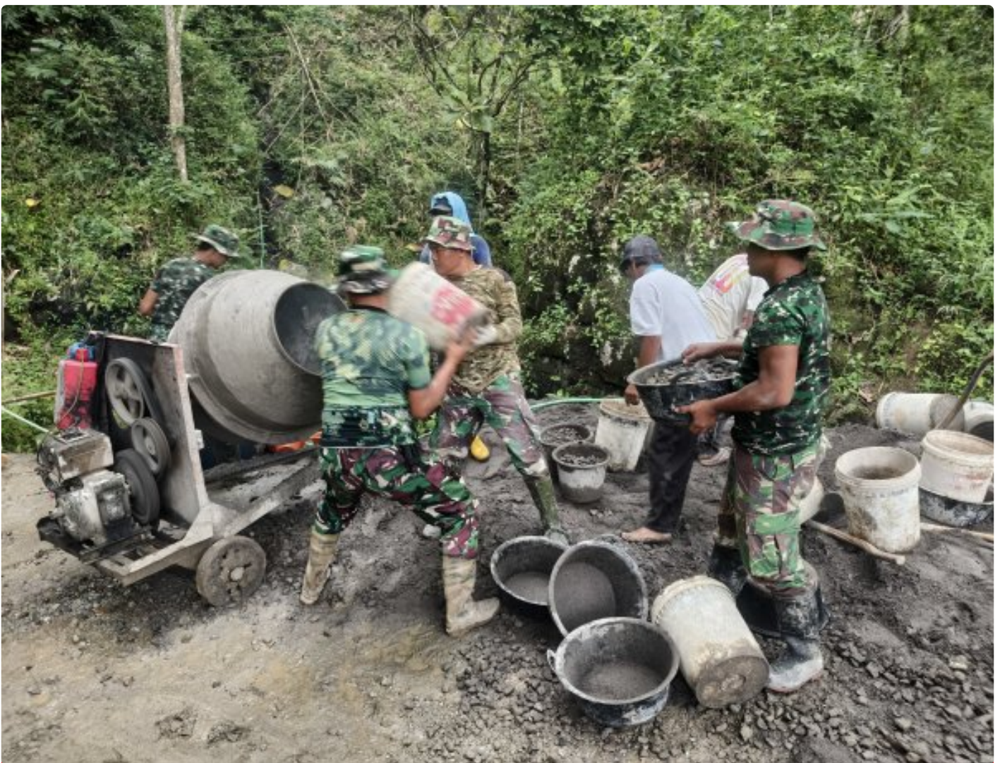
Foto: Anggota Satgas TMMD Reguler ke-127 dari Kodim 0709/Kebumen bersama warga Desa Somagede tak kenal lelah, dengan ketelitian luar biasa, meracik setiap takaran semen, pasir, dan koral dalam pembangunan jalan rabat beton, Kamis (19/2/2026).

KEBUMEN - Di tengah hijaunya perbukitan Desa Somagede, Kecamatan Sempor, Kabupaten Kebumen, pada Kamis (19/2/2026), terukir kisah pengabdian