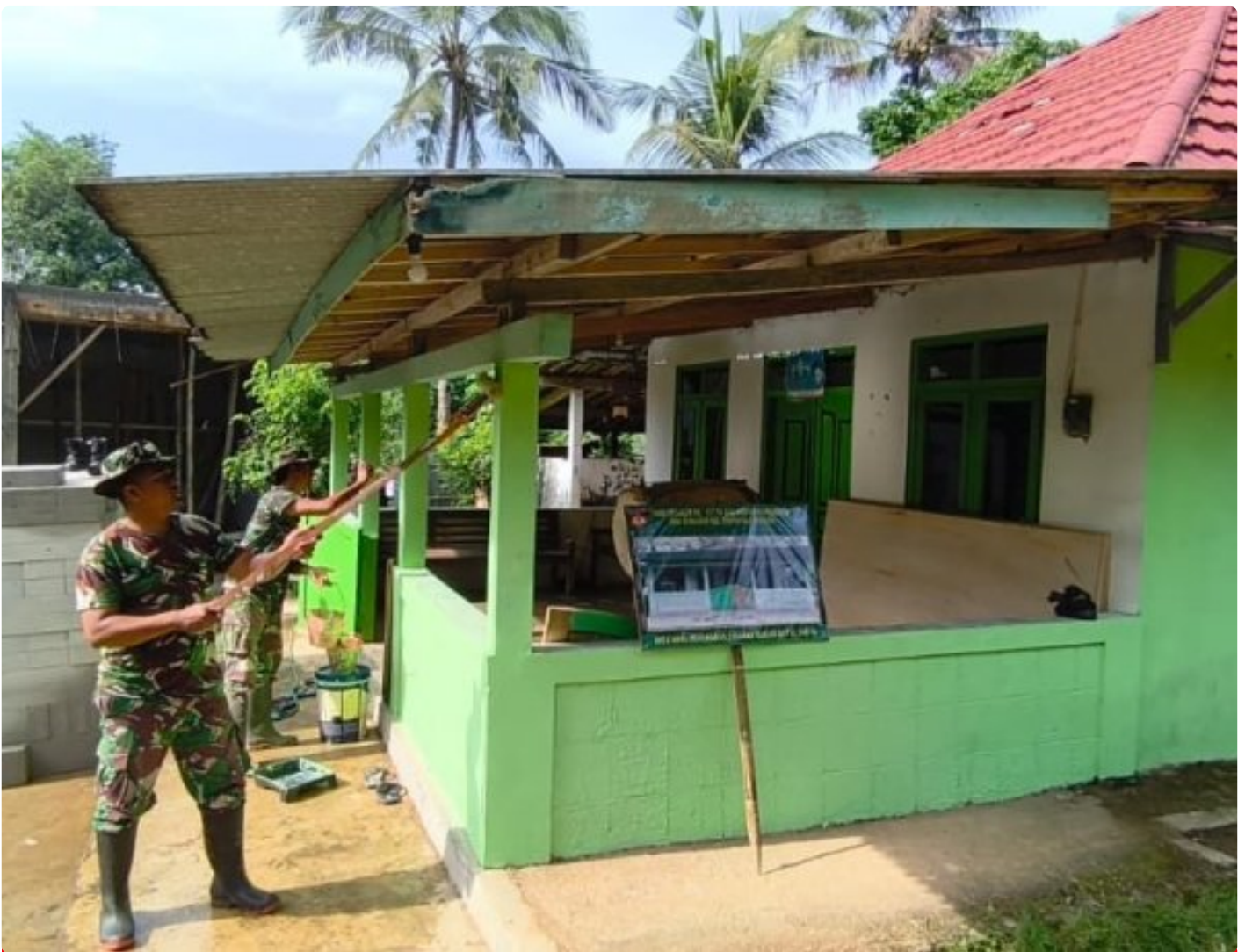
Foto: Anggota Satgas TNI Manunggal Membangun Desa (TMMD) Reguler ke-127 Kodim 0709/Kebumen bersama warga bahu-membahu memperindah Masjid Baitul Tabi'in melalui kegiatan pengecatan, Kamis (19/2/2026).

KEBUMEN - Menjelang bergulirnya bulan suci Ramadhan, semangat kebersamaan dan kepedulian mewarnai Desa Somagede, Kecamatan Sempor, Kabupaten Kebumen. Pada Kamis (19/2/2026), Satgas TNI Manunggal Membangun Desa (TMMD) Reguler ke-127 Kodim 0709/Kebumen bersama warga bahu-membahu memperindah Masjid Baitul Tabi'in melalui kegiatan