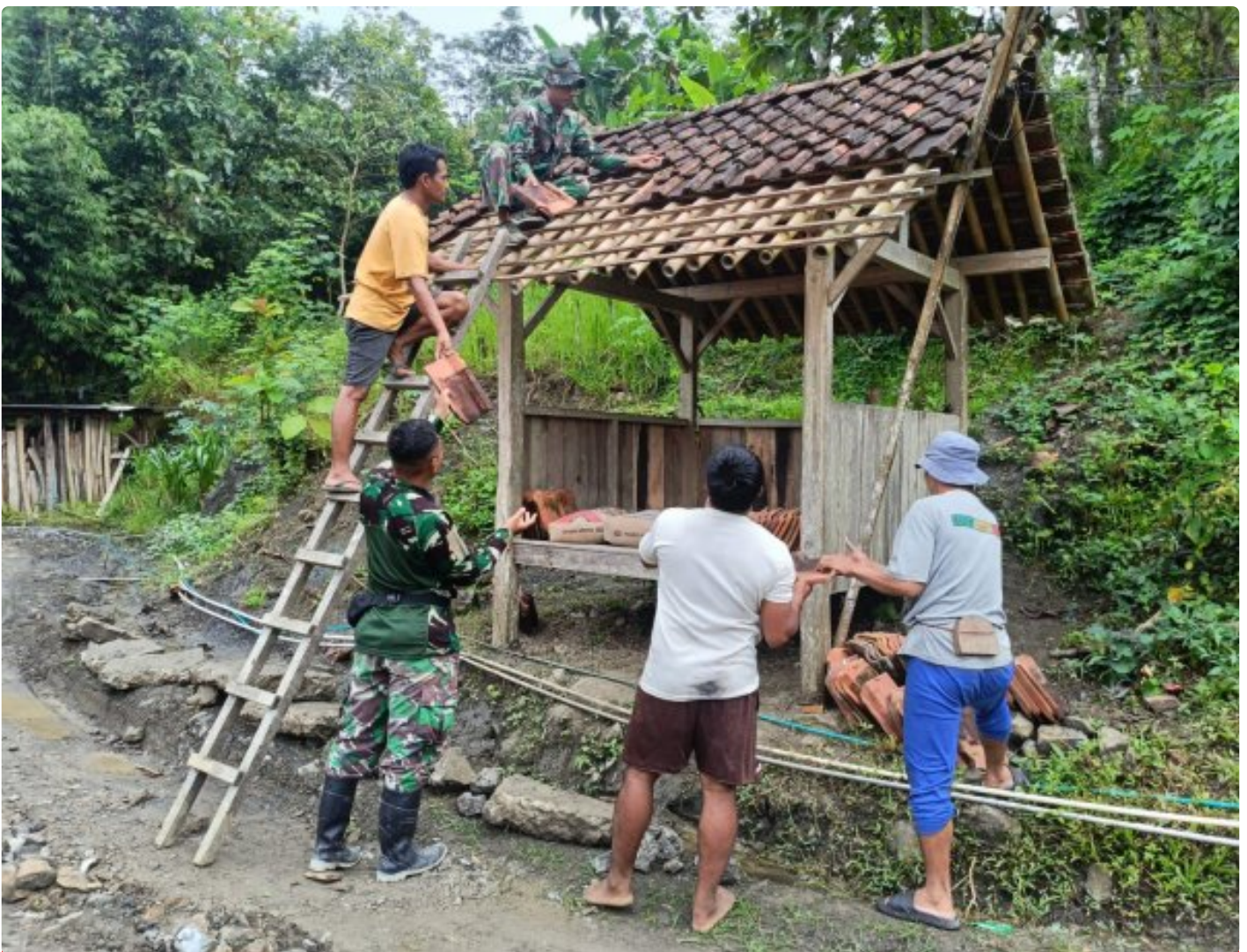
Foto: Saat Satgas TMMD Reguler ke-127 dari Kodim 0709/Kebumen melaksanakan pembersihan atap genteng dan pengecatan Pos Keamanan Lingkungan (Poskamling) di Desa Somagede, Kecamatan Sempor, Kabupaten Kebumen, Jawa Tengah, Sabtu (14/2/2026).

KEBUMEN - Semangat pengabdian prajurit TNI kembali menyatu dengan denyut kehidupan masyarakat desa. Di bawah terik mentari pagi, Satgas TMMD Reguler ke-127