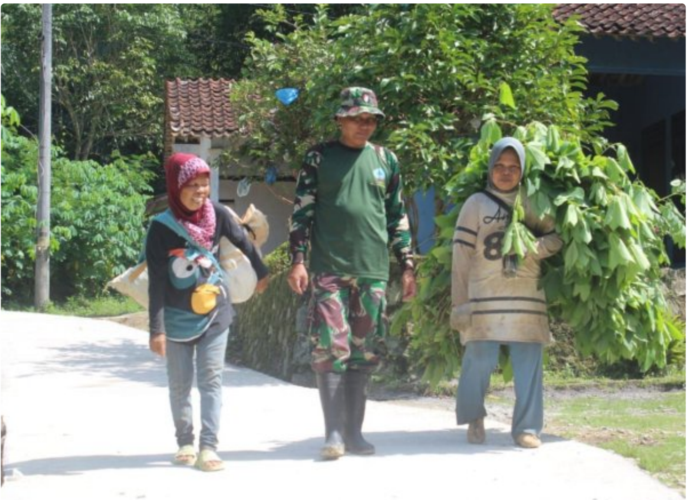
Foto: Anggota Satgas TMMD tak ragu menyisihkan waktu untuk menyapa sekumpulan ibu-ibu yang sedang memanggul rumput di pundak mereka di Desa Somagede, Kecamatan Sempor, Kabupaten Kebumen, Jum'at (20/2/2026).

KEBUMEN - Di tengah hiruk pikuk pembangunan fisik program TMMD Reguler ke-127 Kodim 0709/Kebumen di Desa Somagede, Kecamatan Sempor, Kabupaten